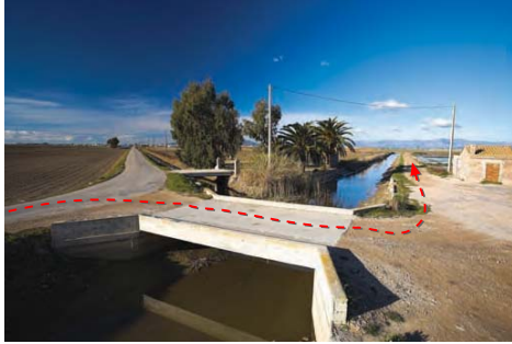
Desaigüe de Nassos