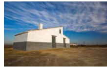
2 Caseta d'arrossar

En aquest punt, si giréssim a l'esquerra continuariem direcció el Goleró , la bassa de les Olles i l' Ampolla , situats a 2,2 Km, 3,7 Km i 7Km respectivament. La nostra ruta, però, continua per la dreta, i circulariem constantment amb la badia del Fangar a la nostra esquerra.