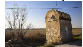
8 Casa coetera