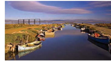
5 Desaigüe del Rompenit