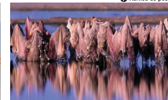
7 Xarxes de pesca