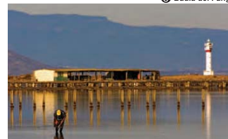
6 Badia del Fangar