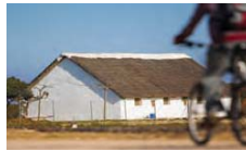
3 Barraca tradicional

Un cop abandonem el Port d'illa de Mar (Km 6,5) , continuem per un camí d'arena compacta que voreja la badia (a la nostra esquerra i amb un desaigüe a la nostra dreta). Al cap de 900 metres, arribem al desaigüe del Rompenit , que el creuem per un pont de formigó amb uns elements metàl·lics ( Km 7,4 ).