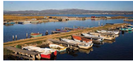
4 Port d'illa de Mar

Aquí, si continuéssim recte podríem enllaçar amb l' itinerari 2 (Ecomuseu-desembocadura), pel camí del Toll , situat a 3,2 Km. La nostra ruta, però, continua a la dreta. Així, deixem el camí asfaltat, girem a la dreta, salvant el desaigüe de Nassos per un pont de formigó i seguim a l'esquerra per un camí de terra durant 1,9 Km, fins arribar a una bifurcació, passat el mas de la Canyadora (Km 13,9) . Seguim a la nostra dreta durant 500 metres més fins arribar a un Stop, on creuarem, amb molta precaució, la carretera de Deltebre a la Marquesa (Km 14,4) . Al creuar la carretera, seguirem per un camí asfaltat (tindrem una granja a l'esquerra) durant 1,2 Km fins trobar-nos, a la nostra esquerra, el camí de terra ( Km 15,6 ) pel qual ja haurem circulat a l'anada, que ens conduirà de nou a la típica caseta d'arrossar (Km 16) , el cementeri (Km 16,5) i l' Ecomuseu (Km 17,1) .