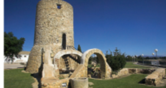
5 Torre de Camarles