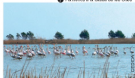
8 Flamencs a la bassa de les Olles