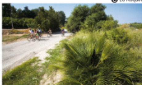
6 Lo Roquer