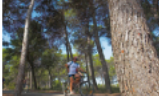
3 Pinets de Camarles

Al final de la carretera del Roquer, hem de fer una forta baixada i tot seguit trobem l'indicatiu per dirigir-nos cap a l'Ampolla (Km 10,2).