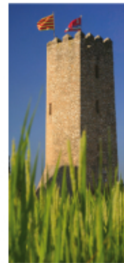
Torre de l'Aldea