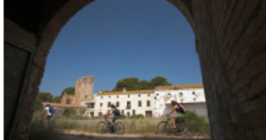
4 Torre de la Granadella

Des de la bassa de les Olles sortim en direcció al poble mariner de l'Ampolla, fins l'estació de RENFE, situada a 2,7 Km, per retornar en tren fins l'Aldea (l'estació de l'Aldea està situada a 3,8 km de l'ermita). Informació horaris: 902 240 202 (pujar la bici al tren és legal i gratuït).