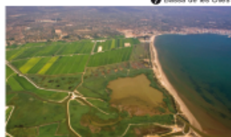
7 Bassa de les Olles