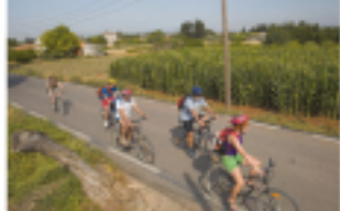
2 Horts l'Aldea-Lligallo