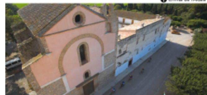
1 Ermita de l'Aldea

Continuem endavant i al cap de 300 m arribem a una rotonda. La creuem recte i seguim direcció l'Ampolla per la carretera del Roquer, des d'on podrem observar la plana deltaica, ja que estem situats –i elevats– just a sobre de l'antiga línia de costa.