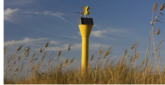
4 Far del Garxal

Quan arribem a la zona dels pinets (Km 4,7), enlloc de girar sobtadament a l'esquerra, seguim recte pel camí de terra (envoltat d'arrossars) durant 2 Km fins trobar la carretera T-340 que uneix Deltebre amb la desembocadura (Km 6,7). Creuem la carretera amb precaució i agafem el carril bici annexat a la via que ens portarà, al cap de 1,6 Km directament al riu. Un cop amb l'Ebre a la nostra dreta, el resseguiu durant 1,5 Km fins arribar al Muntell de les Verges, per a un recorregut total de 9,8 Km.