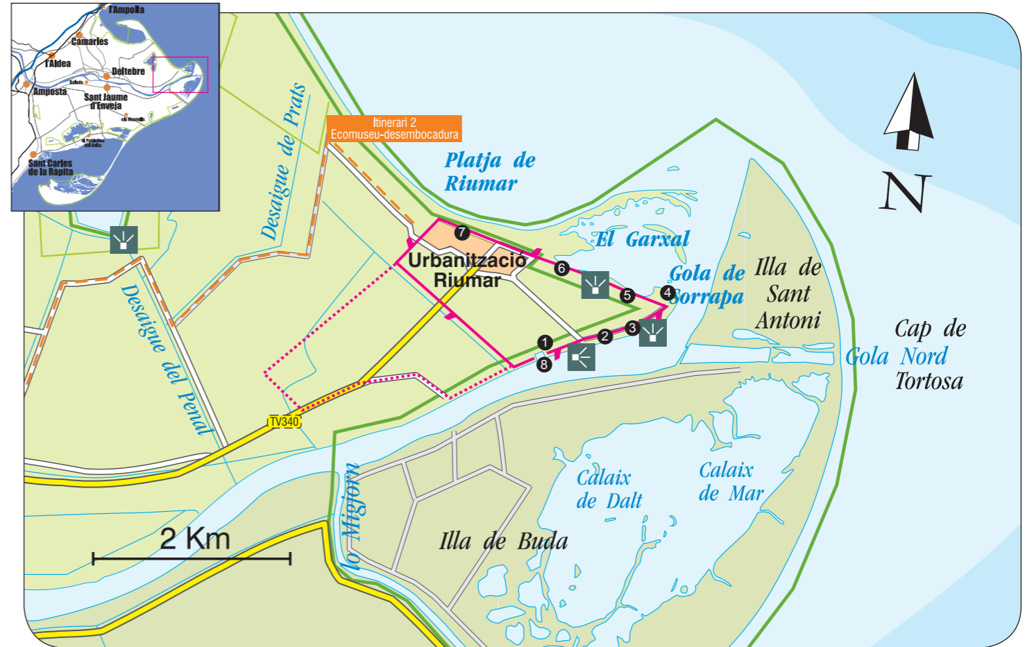
6 Mirador adaptat del Garxal