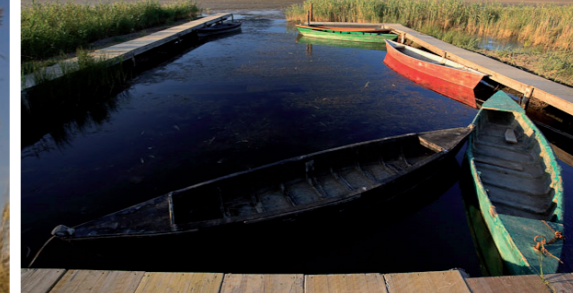
5 Port del Garxal