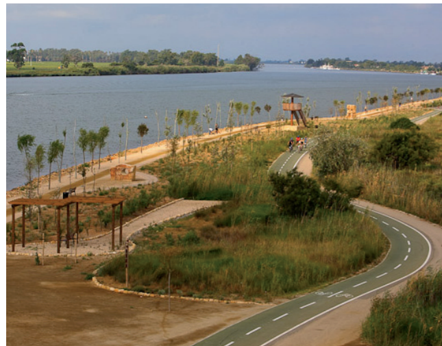
2 Vista aèria des del Zigurat

El Garxal, amb 280 ha, és la bassa del Delta de més recent formació. Està constituïda per petites illes en forma de mitja lluna, modulades pel vent i el mar. Durant el recorregut podreu observar que està envoltada per diferents ecosistemes, principalment zones dunars, salobrar i canyissars que acullen una rica i variada flora i fauna.