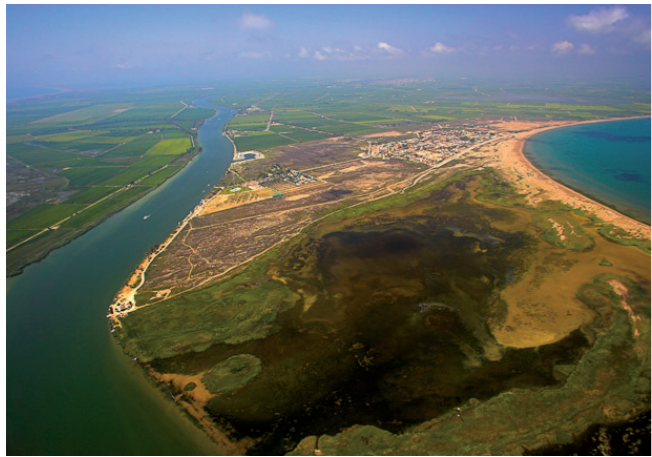
Vista aèria del Garxal