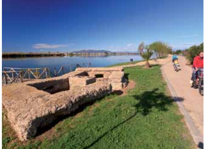
7 Niu ametralladores

Fauna característica: blauet, martinet de nit, martinet blanc, esplugabous, pit-roig, corb marí gros, polla d'aigua, xivitona, fumarell carabanc, gavina vulgar, tórtora turca, verdum.