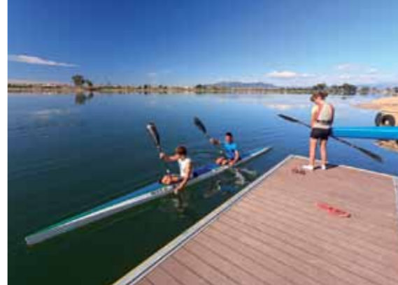
6 Base de piragüisme Martí Calvo