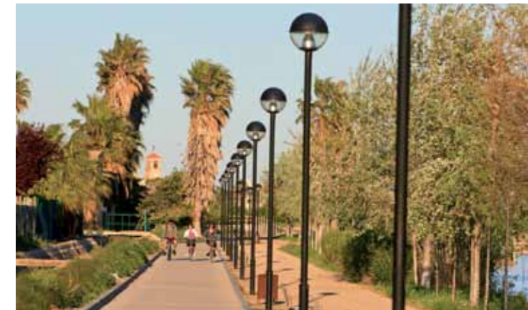
1 Campanar de Jesús i Maria