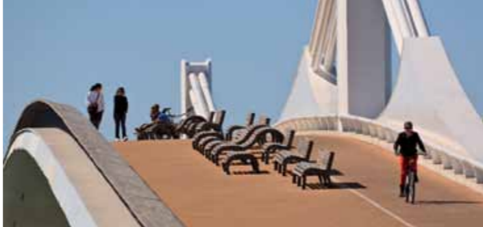
4 Lo Passador

Llambrich i els seus nebots va funcionar fins al 30 de setembre de 2010, data en què es va deixar de passar el riu amb barca a causa de la inauguració del pont Lo Passador.