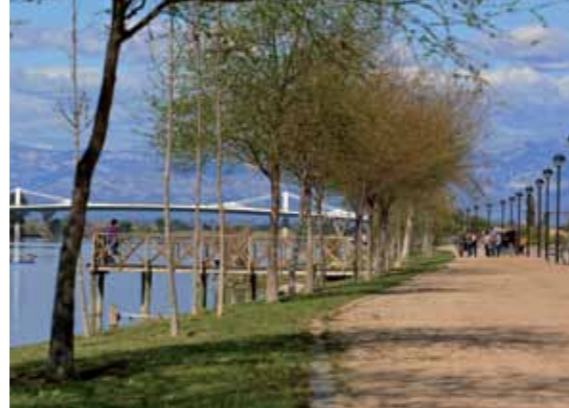
5 Passeig fluvial

5.117 m, Transbordador La Cava - pas de Való. Més conegut per la gent del poble com lo pas de Való, que ve del malnom del iaio.