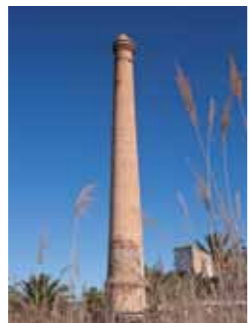
9 Lo Maset