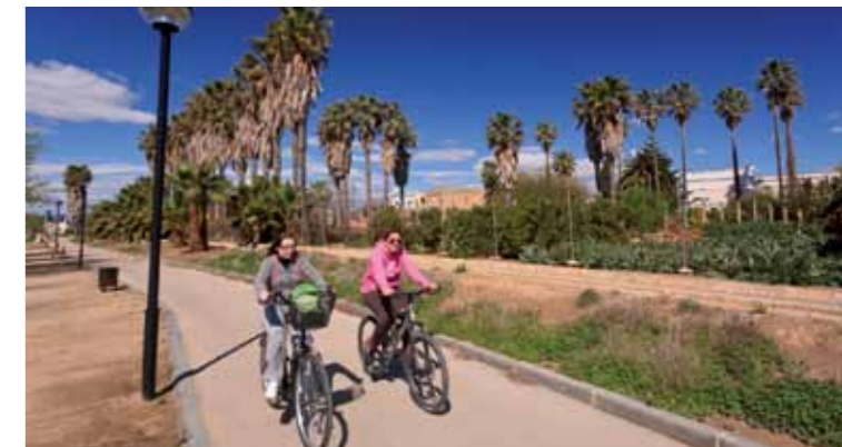
2 Casa dels Belgues